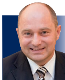
Rainer Bomba Staatssekretär Bundesministerium für Verkehr und digitale Infrastruktur Berlin

1. Talkrunde: Wer bei Planung und Gestaltung von Stadtregionen die Anforderungen der Logistik vernachlässigt, baut auf Sand.