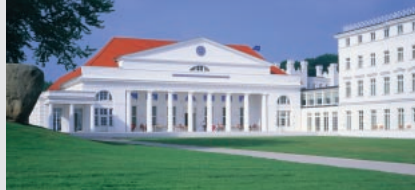
Kempinski Grand Hotel